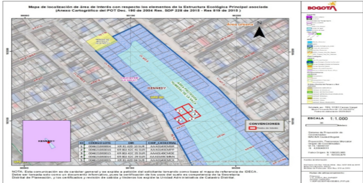
Imagen 1. Ubicación de los predios que componen la bodega de reciclaje (2 – 3 y 4) dentro del PEDH La Vaca Sur.