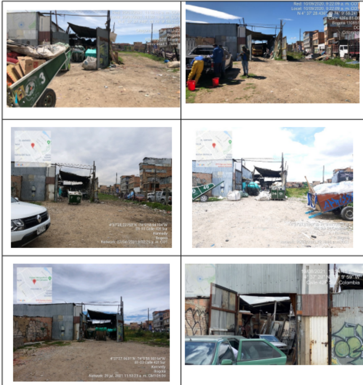
Fotografías 1 a la 10. Evidencia de Funcionamiento de bodega de reciclaje desde el año 2019 al 2021, donde se evidencia disposición, parqueo de vehículos, tránsito de carretas.